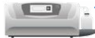
Gerät zur Herstellung von ausgestrichenen Objektträgern