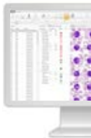
Vision Pro Cell Im